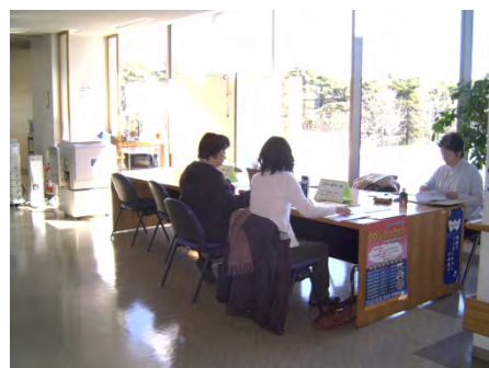
市民活動センターオープンスペース “打合せなどにご活用ください”

柴崎町 1-17-7 シルバー人材センター1階 (定員 10名・机 5台・イス 8脚)