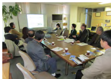
運営委員研修の様子。市内で活動している NPO の生の声を聴き今後の議論に活かしていきます。