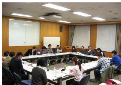
運営委員の様子。この場から様々なアイデアが生まれます。